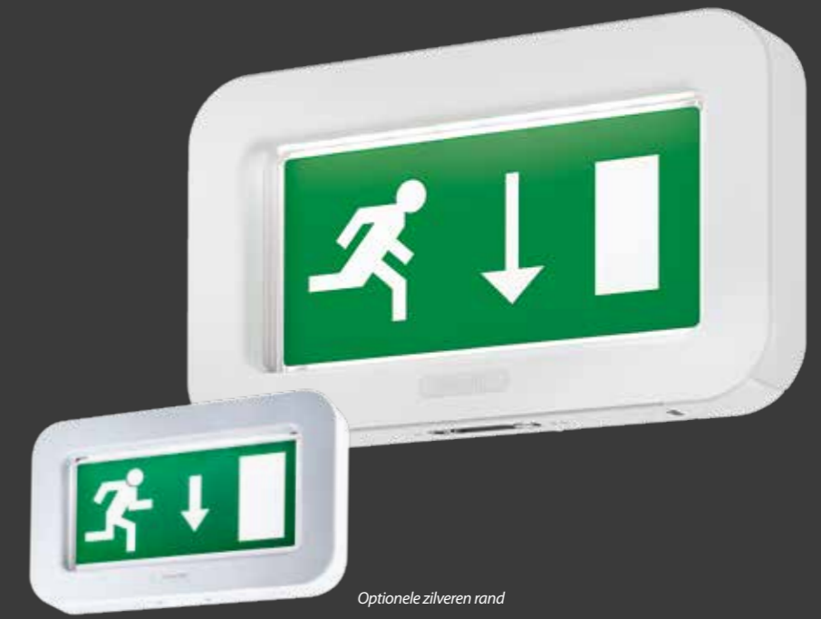
Optionele zilveren rand