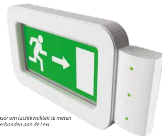
Sensor om luchtkwaliteit te meten is verbonden aan de Lexi

Lege SmartScan accu's kunnen bij Lightronics worden ingeleverd om te worden gerecycled.