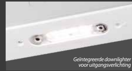
Geïntegreerde downlighter voor uitgangsverlichting