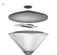
Unicliq LED unit