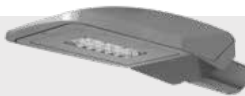
BURAN EXL waar oriëntatie- verlichting van belang is, zoals op fiets- en wandelpaden