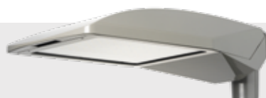
BURAN PLUS EXTREME voor provinciale- en snelwegen