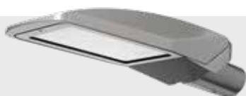
BURAN BAT voor bescherming van flora en fauna